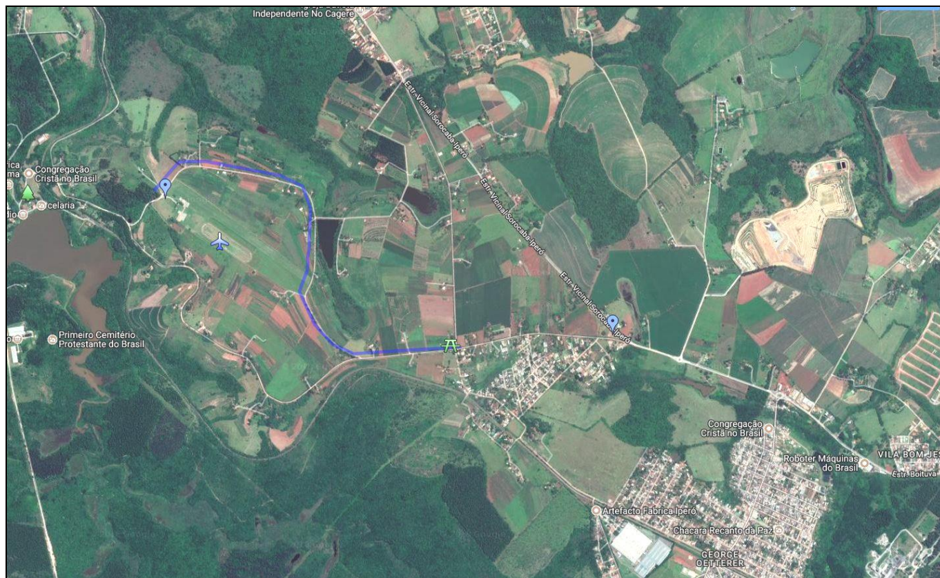
Vista geral do mapa com acesso à pista.